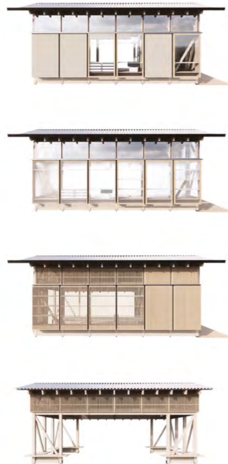
Mødestederne bygger på samme konstruktion, men adskiller sig fra hinanden i udtryk, materialer og indbyggede funktioner.

De fire mødesteder er tegnet i fællesskab af arkitekt- og designvirksomhederne COBE, Reværk, Archival Studies, Pihlmann Architects, Rumgehør og Studio XYZ. Arkitekternes tanke har været at skabe en enkel og inviterende arkitektur. Det velkendte saddeltag gør, at mødestederne passer ind rigtig mange steder. Det store tagudhæng skaber ly og indbyder til at slå sig ned. Væggene har transparente skydedøre, der kan åbnes op, så man kan lave aktiviteter både indenfor og udenfor. Mødestederne er ikke opvarmede, men giver læ og ly. De er tænkt til et liv med årstiderne og om efteråret tager man en ekstra sweater på.