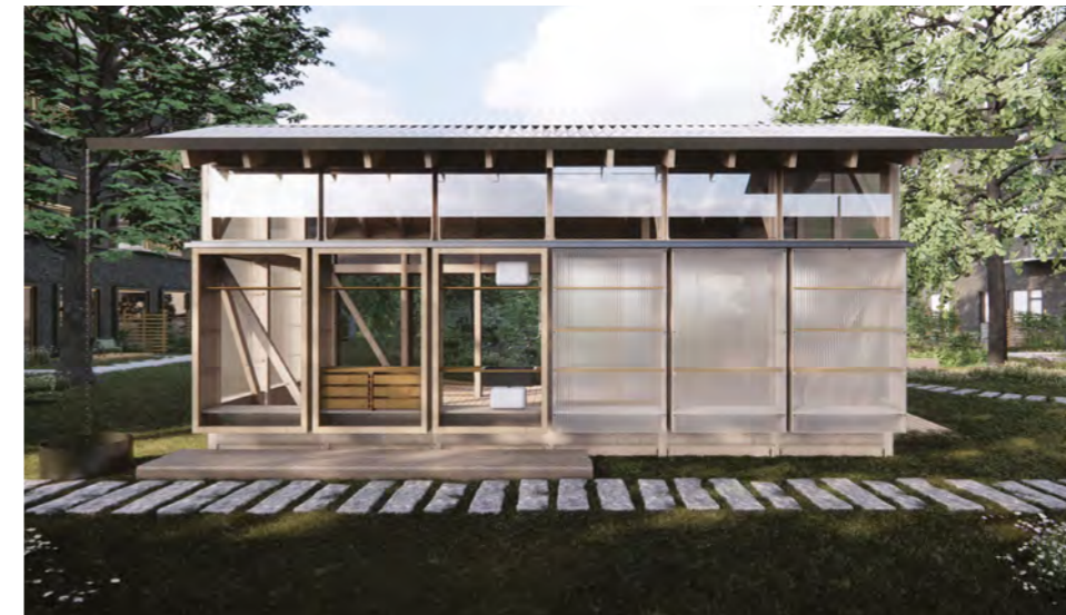
Udestuens bagside, hvor indbyggede funktioner også kan tilgås.

Mødestederne har det samme tag og ligner hinanden som konstruktion. Alligevel er de forskellige og har hver deres muligheder. Variationen opstår, fordi mødestederne er beklædt med forskellige materialer og nogle har åbn, mens andre har lukkede facader. De indbyggede funktioner som skabe, reoler, bænke og vask varierer også fra mødested til mødested. Og så indretter I jer naturligvis lige præcis, som I vil. Der er fire forskellige mødesteder, men de kan bruges på hundredvis af forskellige måder.